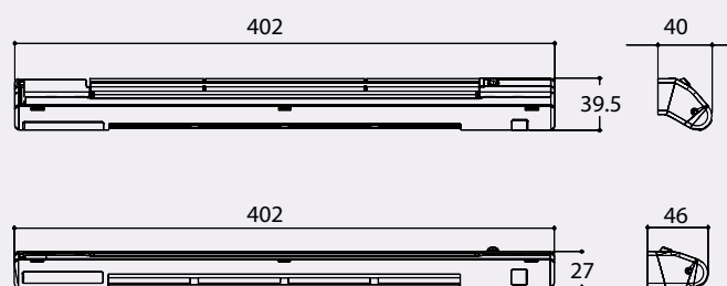
Wymiary w mm